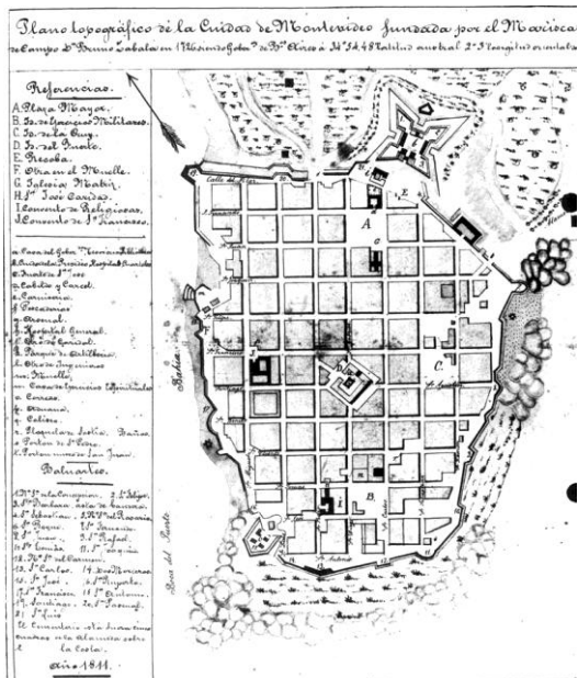
Figura 2. Plano de la ciudad de Montevideo, 1811.